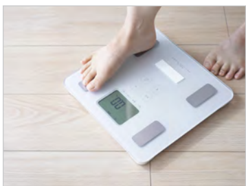
健康測定&クイズラリー