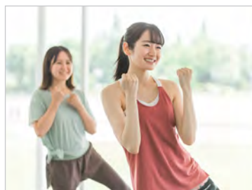
パーソナルトレーナーによる「簡単エクササイズ」